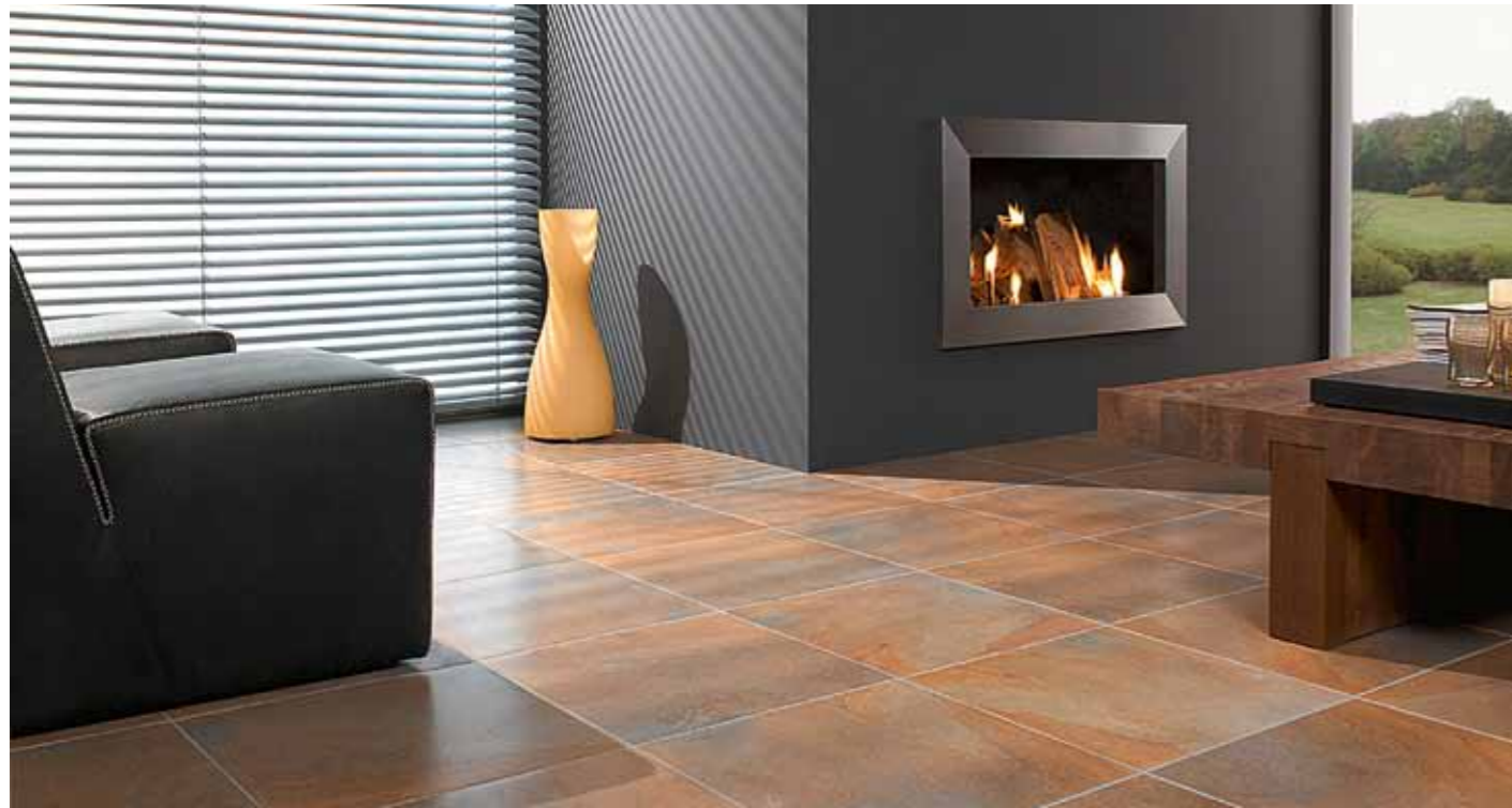
TERRA NOBLE

NATÜRLICHE STEINSTRUKTUREN, VEREDelt ALS WIDERSTANDSFÄHIGE KERAMIK – DAS IST DIE SERIE TERRA NOBLE VON VILLEROY & BOCH FLIESEN. DAS VILBOSTONE FEINSTEINZEUG STEHT FÜR MODERNES WOHNEN MIT ABWECHSLUNGSREICHEN, MULTICOLOR-OBERFLÄCHEN. DIESE STRUKTUR VERLEIHT DER SERIE EINE CHARAKTERVOLLE UND EDLE NATÜRLICHKEIT – MIT BESONDERS SCHMALEN FUGEN VERLEGT, ENTSTEHT EIN MODERNES AMBIENTE.