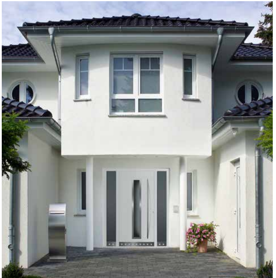
Fenster und Türen aus Kunststoff, Holz und Aluminium.