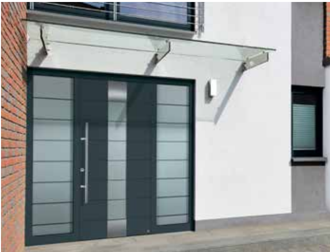
Vordächer und Überdachungen.