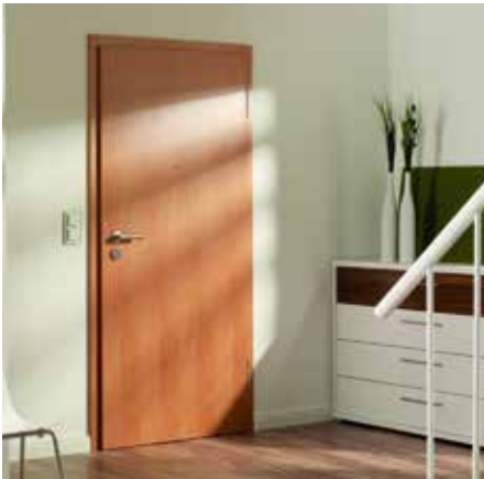
WE-Türen und Funktionstüren.